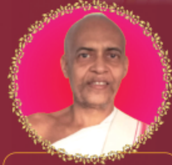
પ.પૂ. ગણિવર્ષ શ્રી ધર્મરત્નસાગરજી મ.સા.

શ્રાવક પારામાંથી સાધુપારામાં, સાધુપારામાંથી ગણિવર્ષ પદવી આપ પામ્યા છો ત્યારે અંતરની ઉર્મીઓથી આપને શુભકામના પાઠવી રહ્યા છીએ. આપને પ્રદાન થયેલ ગણિવર્ષ પદની ભૂરી ભૂરી અનુમોદના કરીએ છીએ.